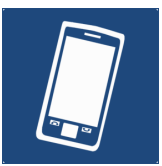
Smartphone (all inklusive)

Um an einer BigBlueButton-Konferenz des Kreismedienzentrums teilzunehmen, benötigen erstmal die nötige Technik. Man benötigt grundsätzlich einen Internetzugang und ein internetfähiges Gerät mit Kamera sowie ein daran gekoppeltes Headset (zur Not reicht ein