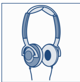
Headset (Mikro + Kopfhörer)

Von Marcus Lüpke, MPB NLQ 2020, Pictogramme aus: Picto-selector unter licence CC [BY-NC-SA]