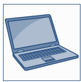
Laptop (meist inkl. Kamera)