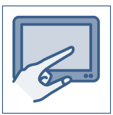
Tablet (all inklusive)